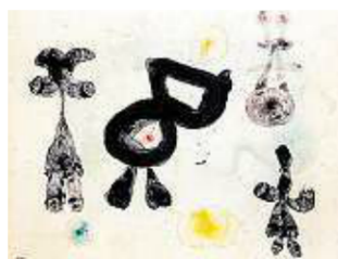
Homem, Mulher, Pássaro