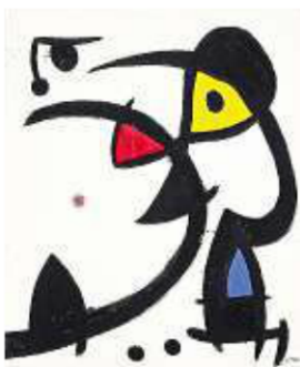
Dois Personagens Caçados por um Pássaro