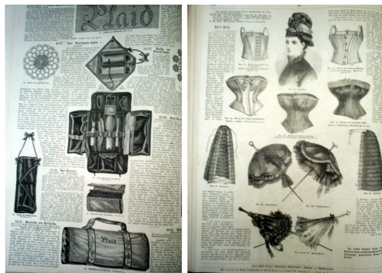
Figura 5 – Acessórios: bolsa utilitária e sombrinhas.

Acessórios como bolsas e sapatos também constam nas revistas, inclusive ensinando a confeccioná-los de tricô ou crochê. Bem como chapéus, sombrinhas e ainda bolsas utilitárias com divisórias diversas para guardar desde objetos de costura, até pentes e escovas. Há ainda acessórios para a casa como cortinas, toalhas, almofadas, entre outros.