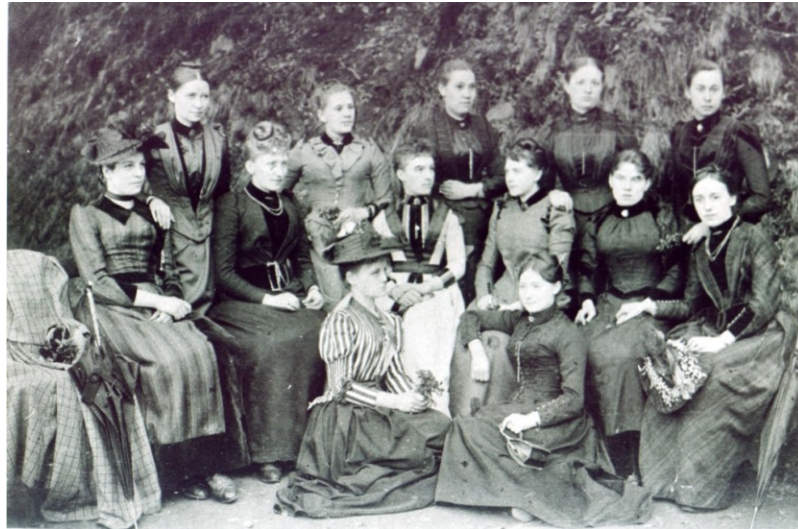
Figura 2 – Imagem fotográfica: mulheres da sociedade da Blumenau Colônia. Final do século XIX.

tranças. Uso de acessórios como broches na gola ou correntes no pescoço e chapéu com abas curtas atrás se projetando na frente e levemente nas laterais, adornado por tules e flores.