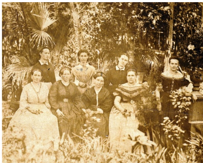
Figura 1 – Imagem fotográfica: mulheres da sociedade da Blumenau Colônia. Início da colonização.

Fica evidente, na imagem fotográfica, que os trajes usados no segundo quinquênio do século XIX correspondiam aos padrões de tendências de moda do início do século. Padrão este descrito por Laver (2003) como romântico e extravagante, tendo como traços maiores o decote de ombro a ombro com mangas curtas e fofas, a saia ampla e a cintura fina é marcada na altura do umbigo.