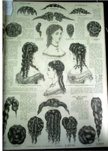
Figura 6 – Penteados. Fonte: (MODENWELT, 1869d, p.67).

Constavam em todas as revistas contos literários, que provavelmente continuavam a cada próxima edição, e partituras de música, ambos são emblemas de um universo feminino centrado no lar e na família.