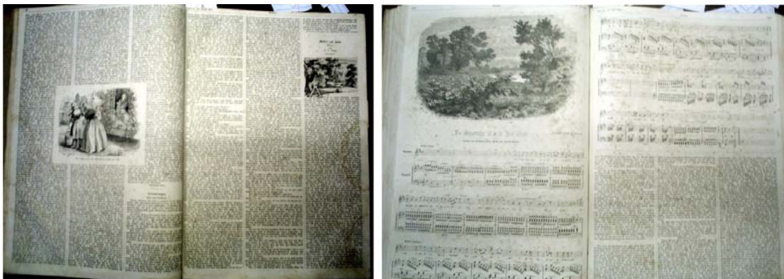
Figura 7 – Romances e Partituras. Fonte: (VICTORIA, 1863b, p.28-29) e (VICTORIA, 1863c, p.216-217).

Constavam em todas as revistas contos literários, que provavelmente continuavam a cada próxima edição, e partituras de música, ambos são emblemas de um universo feminino centrado no lar e na família.