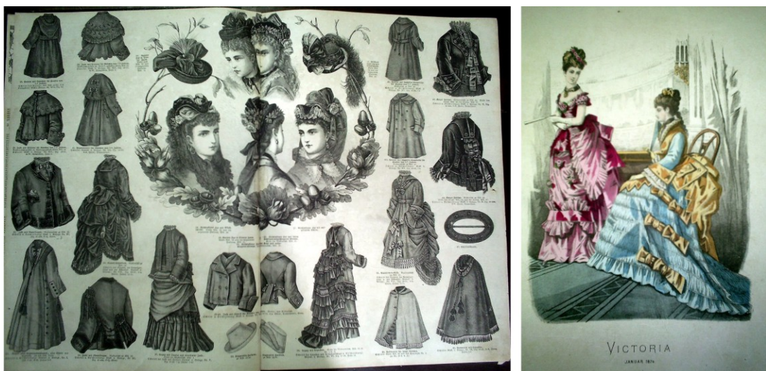
Figura 3 – Ilustração de peças variadas e ilustração colorida.

As roupas apresentadas são por vezes retratadas vestindo as mulheres ou sozinhas com destaque maior para as peças, em ambos os casos, são divididas em categorias, como: corpetes, vestidos, saias, conjuntos, punhos, golas, manta, roupa de baixo, roupa infantil... Duas vezes a cada mês na revista “Victoria” há uma página específica pra uma ilustração colorida.