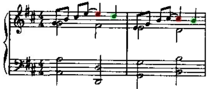
Ilustração 3: compassos 3-4 do Prelúdio

resolvido no próximo acorde. Geralmente são sétimas resolvendo em sextas ou nonas resolvendo em oitavas (dissonâncias em vermelho e resoluções em verde).