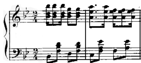
Ilustração 5: Brejoro, de Ernesto Nazaré (c.21-22) -uso de oitavas

Há ainda, para finalizar essa análise descritiva do Foreground , alguns pontos a serem salientados. O uso de oitavas nas melodias também remete essa obra a influência da música para piano do romantismo e do choro.