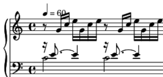
Ilustração 2: motivo principal do Prelúdio da Fuga em Dó maior de Bach

Esse procedimento, de desenvolver uma composição inteira a partir de um mote apresentado ao início, foi usado magistralmente por Bach, por exemplo, no Prelúdio para a Fuga em Dó maior, no volume I do Cravo Bem Temperado.