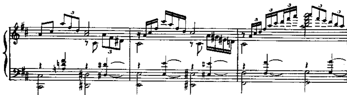
Ilustração 4: Compassos Finais do desenvolvimento (c.28-30) - utilização de motes do vocabulário do choro e romantismo; cromatismos e grande contraste de tessituras

Há muitas influências do romantismo presentes, particularmente na dinâmica e na escrita pianística: súbitos forte , sforzando , piano , uso de oitavas no baixo e exploração dos diversos registros do piano, fazendo com que muito da expressão de intensidade dessa obra seja produzido pelo espírito dramático do romantismo. Paralelamente, há o uso de padrões típicos do choro, tais como grupos de semínimas e tercinas lembrando o baixo do violão de sete cordas. O grande uso de cromatismos nessas partes também confirma essa relação entre choro e romantismo.