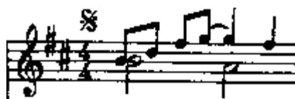
Ilustração 1: motivo principal do Prelúdio das Bachianas Brasileiras 4

A música é construída como um grande desenvolvimento de um pequeno motivo, apresentado logo no primeiro compasso da peça: