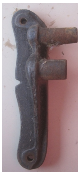
Foto 05: Representação de uma peça que compõe o mecanismo para assento retrátil

02 peças de ferro fundido que compõe o mecanismo para assento retrátil (segundo foto 05);