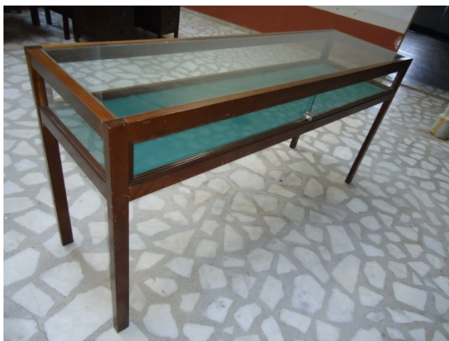
MESA EXPOSITORA (AxPxL) 1,00x0,60x2,00

O objetivo desta Coordenadoria com esta aquisição é equipar o Museu com mobiliário adequado para a exposição permanente dos acervos que estão em fase final de recuperação de forma que sejam condicionados adequadamente para exposição ao público visitante, o que justifica tal solicitação.