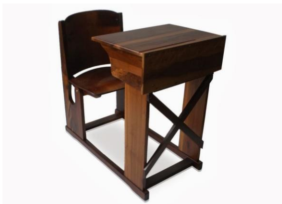
Figura 4.1. Museu da Escola Catarinense. Objetos escolares. Carteiras Cimo. Acervo MESC

Outro objeto bastante comum eram os quadros Parker, em salas de aula organizadas segundo os princípios intuitivos 17 . Conforme Teive (2008), nas paredes havia a abundância de quadros intuitivos para o ensino das ciências naturais, história e geografia e Quadros Parker para o aprendizado da aritmética. Em lugar de destaque ficavam o globo terrestre para o ensino da geografia, o museu escolar, com sua coleção de objetos, para a prática das lições de coisas de história natural, o quadro-negro para garantir a convergência das atenções, indispensável para a prática do ensino simultâneo e a bandeira nacional, símbolo máximo da Pátria e da República, para as lições cívicas.