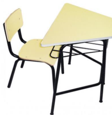
Figura 4.2. Museu da Escola Catarinense. Carteiras atuais.

E para completar o cenário, a incorporação ao cotidiano da sala de aula do símbolo da era industrial moderna: o relógio, marcando os ritmos da ação educativa medindo os