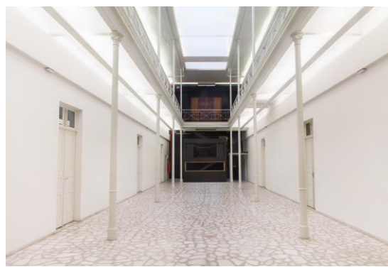
Figura 1.2. Museu da Escola Catarinense. Átrio. Acervo do Mesc. 2016