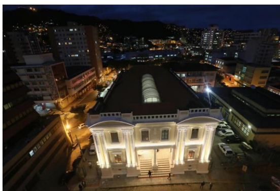
Figura 1.1. Museu da Escola Catarinense. Fachada. 2014

Através do Decreto Municipal nº 521/89, de 21 de dezembro de 1989 vários prédios integrantes do conjunto histórico do centro da cidade foram classificados, de acordo com sua importância histórico/arquitetônica, em categorias e o Museu da Escola Catarinense está classificado como P1. Estes são os imóveis, que pelo seu valor excepcional ou monumentalidade, são totalmente preservados tanto o interior como o exterior, não podem ser demolidos nem modificados.