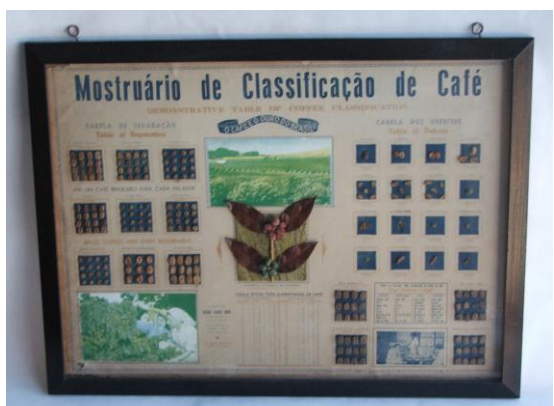
Figura 3.2. Museu da Escola Catarinense. Quadros Parietais.

Observa-se também, depoimentos que nos apontam questões que as pesquisas sobre objetos, cultura material escolar e outros relacionados, sinalizam como vestígios. Celebram objetos que levam a reviver a infância, uma volta no tempo e aos primeiros anos de escola, relembram tempos em que se respeitava a escola e os educadores. Enfatizam o Museu como local de reflexão e seus hábitos de pontualidade, honestidade e demais valores que se aprendiam na escola, como coisas perdidas no tempo. Muitos lembram dos sons, passos, risadas nos corredores das escolas. Há menção ao fato de que os objetos, como a sala de aula dos anos 50 os levaram "de volta aos 12 anos". Deixam registros de uma "memória imaginária", que idealiza uma vivência que jamais será vivida em tempos presentes. Outros lançam perguntas: "Como seria ser estudante neste espaço? Como seria lecionar nestas salas de aula (agora salas de um museu)? Qual a importância destinada à cultura e educação neste tempo que passou?"