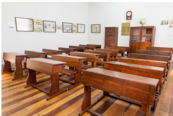
Figura 2.1. Museu da Escola Catarinense. Sala de aula de época, anos 50. Grupo escolar.