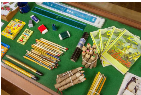
Figura 3.1. Museu da Escola Catarinense. Objetos escolares. Acervo MESCC