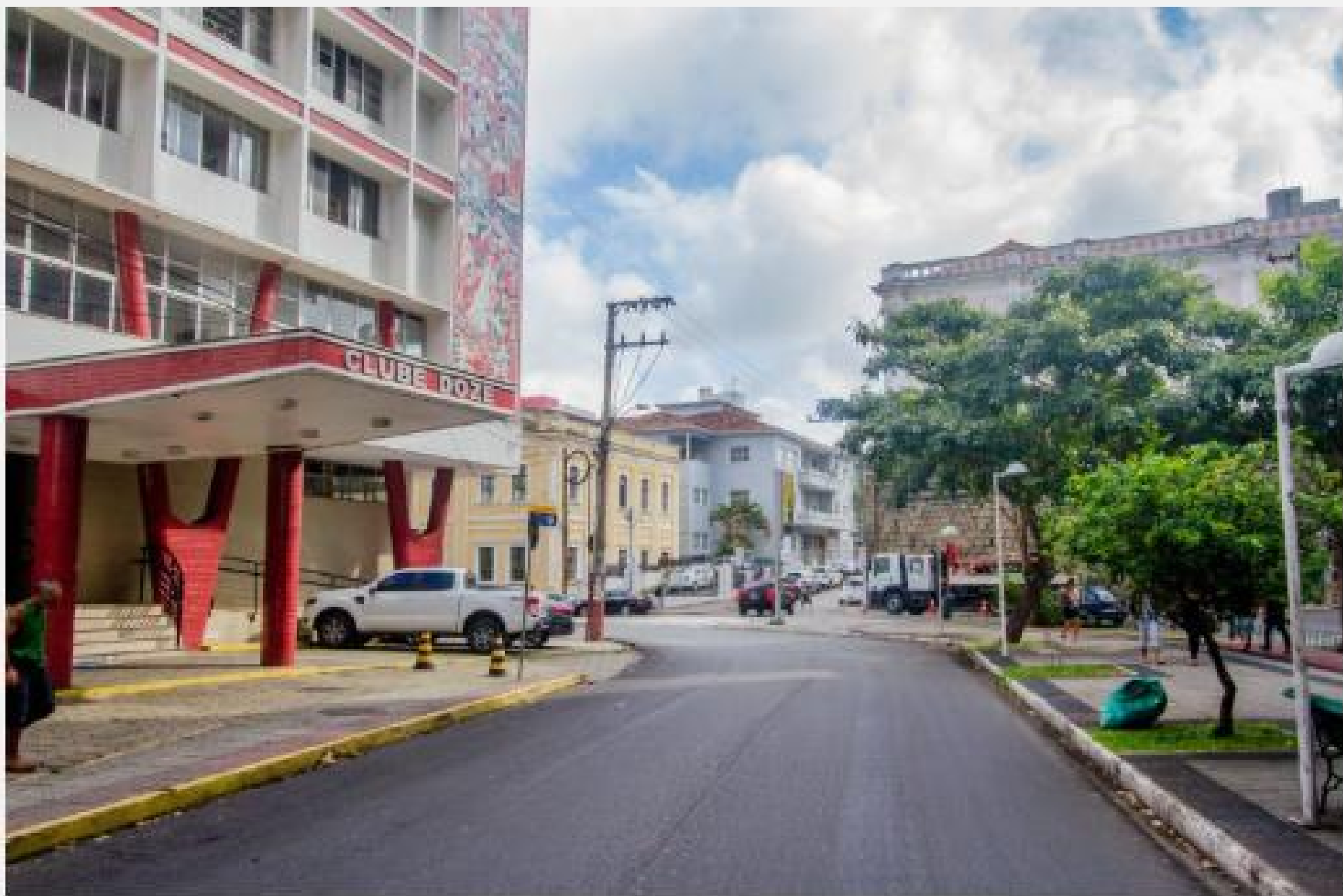
Avenida Hercílio Luz