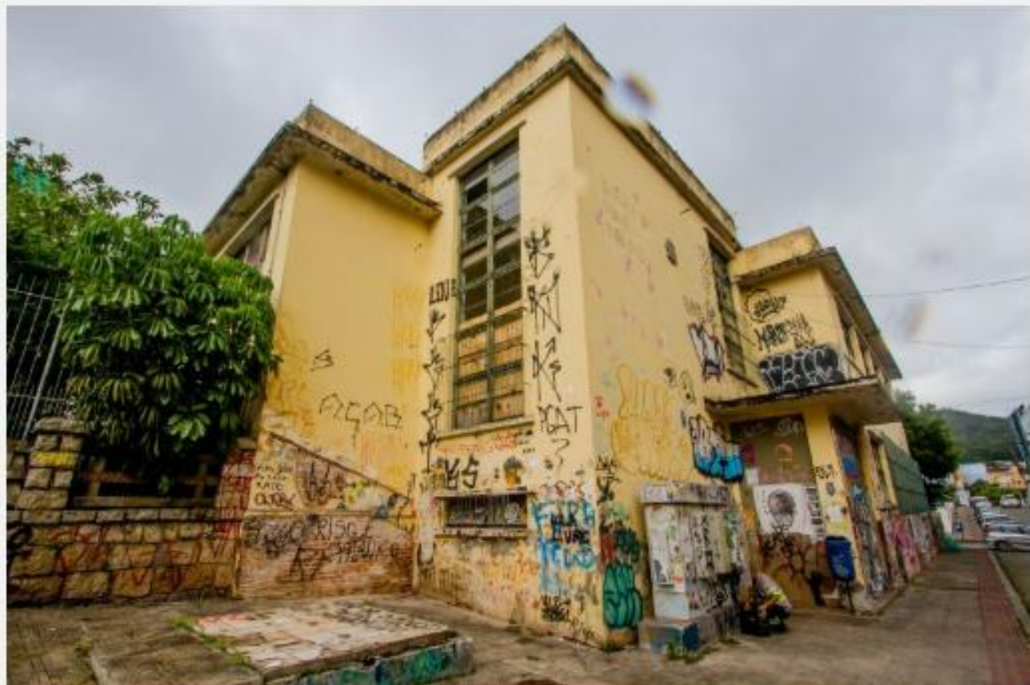
Escola Antonieta de Barros, onde funcionada o Instituto de Educação Dias Velho

Era formado por dois prédios: a Escola Normal (atual Museu da Escola Catarinense) e a edificação da Escola Antonieta de Barros, com uma escada que ligava ambas.