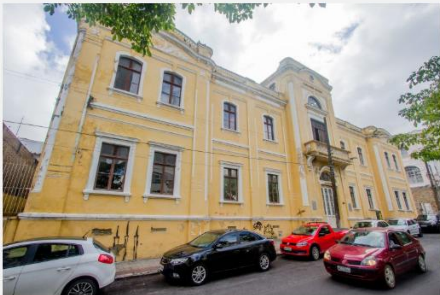
Casa José Boiteux, antigo Instituto Politécnico – Foto: Flavio Tin/ND

Segundo o historiador Rodrigo Rosa, da FCC (Fundação Catarinense de Cultura) conta que a Casa José Boiteux, onde funciona a atual sede do IHGSC (Instituto Histórico e Geográfico de Santa Catarina) e da Academia Catarinense de Letras, é um marco inicial no processo de realocação das instituições de ensino do lado Leste da Praça 15.