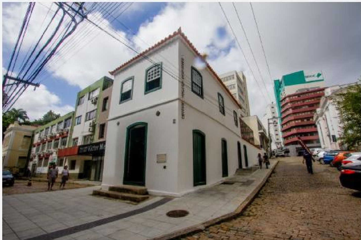
Museu Victor Meirelles, em frente à Escola Antonieta de Barros

Com estética colonial, a casa que abriga o Museu Victor Meirelles, em frente à Escola Antonieta de Barros, data do começo do século 19. O prédio teve diversas funções ao longo dos anos, como açougue e comércio de secos e molhados.