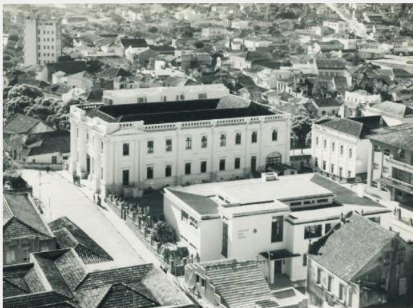
Prédio onde fica o Mesc e, ao lado, Escola Antonieta de Barros

Nesse período era comum a prática de nomear ruas e bairros pela topografia do lugar, casa comercial ou habitação importante.