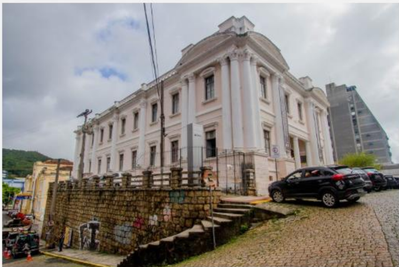
Antiga Faculdade de Educação – Foto: Flavio Tin/ND

Por causa de uma reforma no sistema de ensino, em 1935, a Escola Normal Catharinense passou a ser o Colégio de Educação. Em 1947 se uniu ao Colégio Estadual Dias Velho, nome antigo dado à Escola Antonieta de Barros.