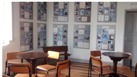
Fachada e dependências do Museu da Escola – dezembro de 2014

O vídeo da entrevista pode ser visualizada nos seguintes links: